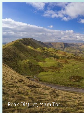
Peak District, Mam Tor

7. den Návrat domů, čas příjezdu bude upřesněn.