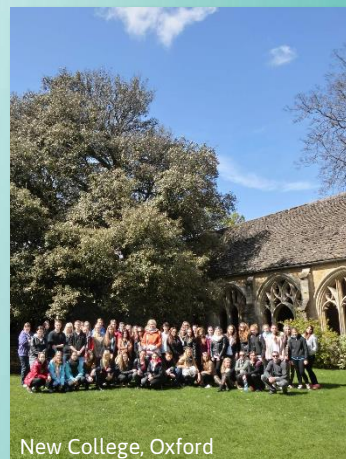
New College, Oxford