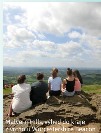
Malvern Hills, výhled do kraje z vrcholu Worcestershire Beacon

6. den Návrat domů v podvečerních hodinách.