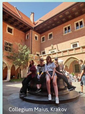
Collegium Maius, Krakov

Podzemní království solných dolů ve Wieliczce je místem, které uchvátí každého. Čekají Vás obrovské solné sály, podzemní jezera, masivní konstrukce trámů a unikátní sochy vytesané do soli. Od místního průvodce se dozvíte vše o fungování místních dolů, tvrdé práci, ale i legendách, které se o bílém zlatě vyprávějí. A hlavně - dýchat! ☺