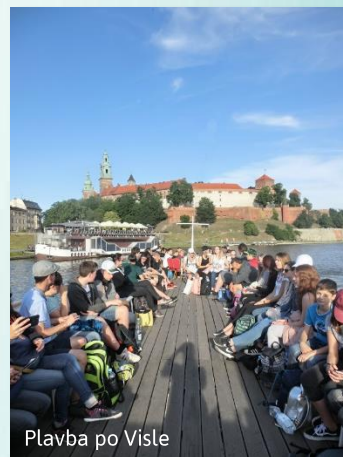
Plavba po Visle

To nejlepší z Malopolska – Krakov a solné doly ve Vieličce, obojí na seznamu UNESCO a k tomu lekce historie v Osvětimi.