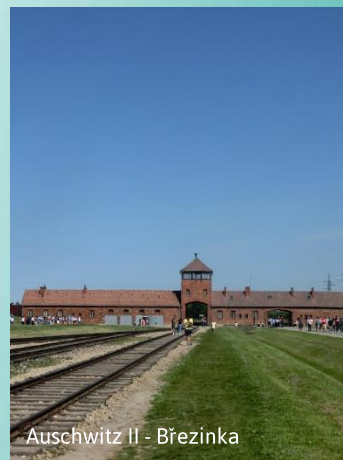
Auschwitz II - Březinka