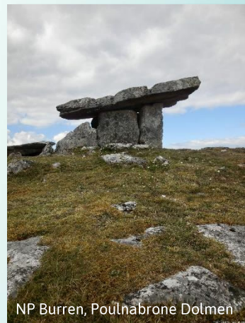
NP Burren, Poulabrone Dolmen