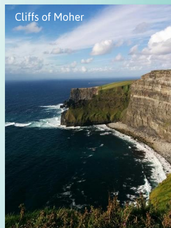
Cliffs of Moher